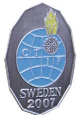
Feuerwehrjugend-Leistungsabzeichen des CTIF