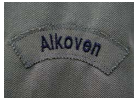
Ortsbezeichnung am Ärmel – Unter dem Schriftband kann ein Wappen gemäß Pkt. 12.2.5. getragen werden.