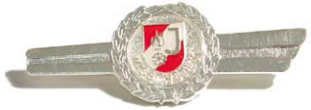
Wissenstestabzeichen in Silber

Das FJWTA ist eine Spange, in dessen Mitte das emaillierte FJ- Korpsabzeichen, darunter die Bezeichnung „Wissenstest“, beides umrandet von einem Eichenlaubkranz, ist. Das FJWTA gibt es in der Ausführung Bronze, Silber und Gold.