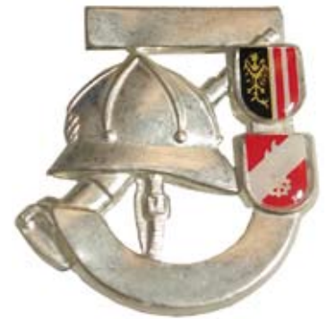
Feuerwehrjugend-Leistungsabzeichen in Silber (Landesbewerb)