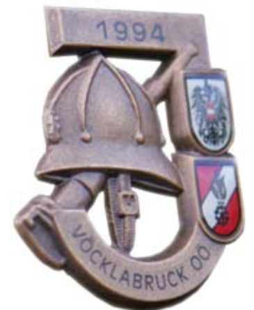
Feuerwehrjugend-Leistungsabzeichen in Bronze (Bundesbewerb)